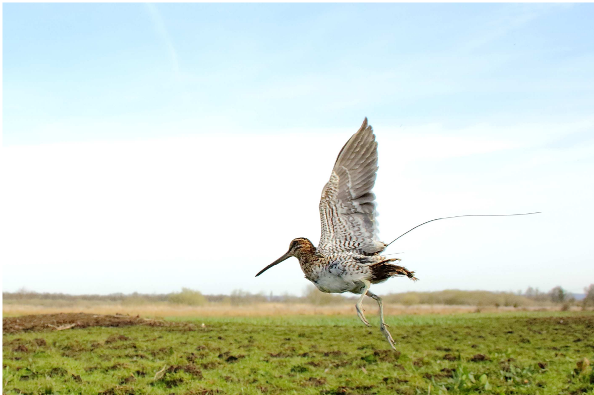
Bécassine des marais à l'envol équipée d'une balise GPS/Argos

Damien Coreau, Kévin Le Rest ONCFS – Patrice Février CICB